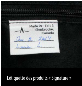
L'étiquette des produits « Signature »

Trois produits « Signature » seront lancés, en commençant par le « D ». La série s'accroîtra au fur et à mesure. Pour 2015, seuls les sacs de cette collection porteront l'étiquette « Signature », mais : « Nous intégrerons possiblement ces étiquettes à tous nos produits dans le futur », nous dit M. McKenzie. Pour savoir où vous procurer les produits d'Arkel, visitez le http://www.arkel-od.com/us/tlm5-dealers .