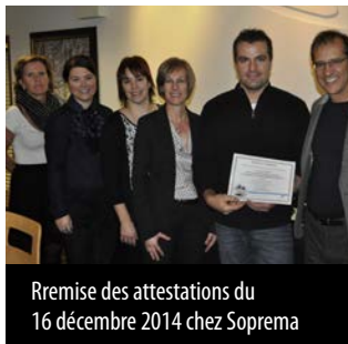
Remise des attestations du 16 décembre 2014 chez Soprema

Le projet du CSMO Textile sur l'acquisition des compétences de base vient de se terminer. Ce projet sur deux ans, qui a débuté en 2012, permettait aux employés inscrits d'acquérir des notions essentielles, par exemple, en français, en anglais et en mathématiques, dans le but de réussir le test de développement général (TDG) ou le test d'équivalence de niveau secondaire (TENS) pour acquérir une attestation. Au total, 81 employés étaient inscrits. Ceux-ci provenaient des entreprises textiles suivantes : Garlock à Sherbrooke, Niedner à Coaticook, Régitex à Saint-Joseph-de-Beauce, Soprema à Drummondville et Textil'Art à Laval. À la suite de leurs efforts et de leur persévérance, ce sont 23 participants qui ont reçu leur diplôme et 1 autre participant poursuit sa formation pour acquérir son 5 e secondaire. Parmi les retombées positives de la formation, nous relevons : la fierté d'aller jusqu'au bout d'un projet et de le réussir, une meilleure estime de soi, la capacité d'écrire sans fautes et la découverte de nouvelles aptitudes. Pour les entreprises, en plus de soutenir leurs employés, cela a un impact sur la productivité et la qualité du travail.