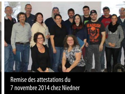
Remise des attestations du 7 novembre 2014 chez Niedner

Les statistiques sont inquiétantes : 49 % des Québécois ont des difficultés de lecture et 800 000 de ceux-ci sont analphabètes! Lorsque l'on sait que 28 % de la main-d'œuvre du secteur textile est sans diplôme 1 , les entreprises doivent être prévoyantes. C'est ce qu'ont fait les employeurs qui ont participé à ce projet en s'occupant eux-mêmes du développement des compétences de leurs employés, et ce, tout en améliorant leur flexibilité. En effet, ces derniers sont maintenant mieux outillés pour faire face aux changements organisationnels et technologiques. D'ailleurs, la formule de conciliation travail-études a beaucoup plu aux participants, puisqu'ils étaient rémunérés pour apprendre et que les cours se donnaient sur les lieux de travail.